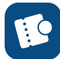
コモニー店舗アプリ